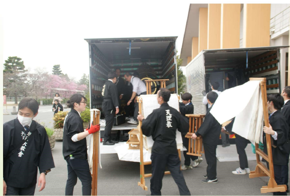
大勢の方の力で片付けもできました。