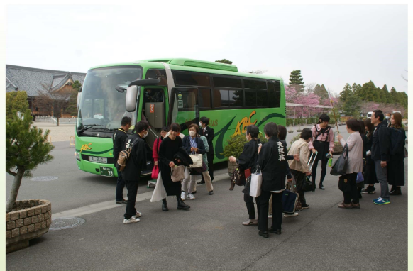
遠方からバスで参加