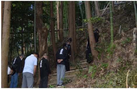
乙木塚慰霊祭 10月5日