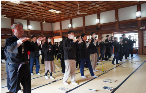
第5回若人の集い 10月28日