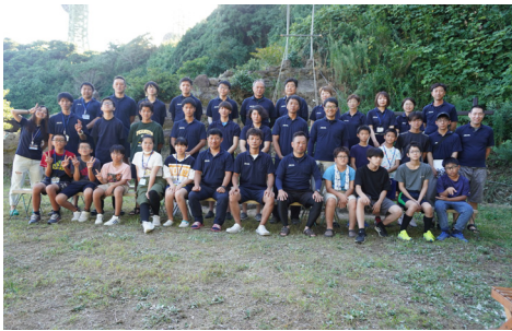
第62回旭日キャンプ 8月5日～7日