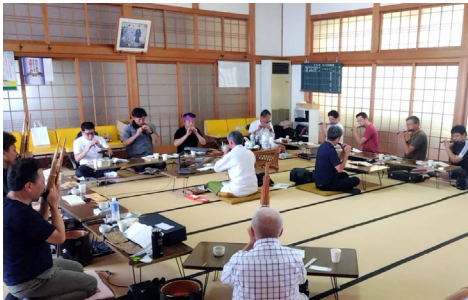
祭典雅楽奉仕者研修会 8月28日～29日