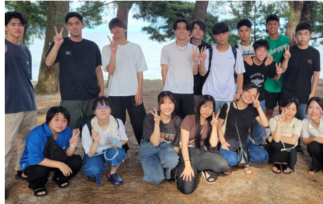
学生サマースクール 8月22日