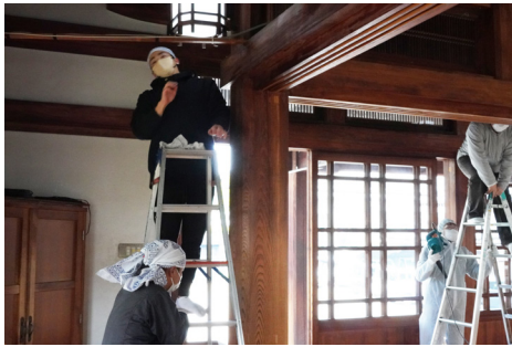
神殿内外大掃除 12 月 11 日