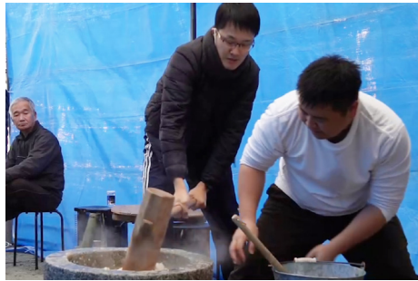
お餅つき 12 月 28 日