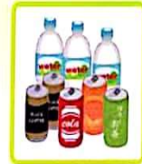
ペットボトル 缶飲料など