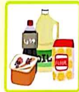
しょうゆ・味噌 調理油・砂糖 などの調味料