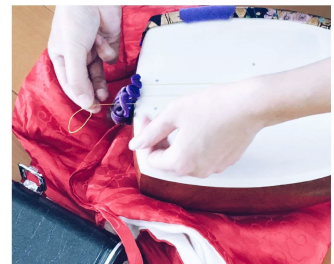
糸のかけ方 根緒が倒れていると、音が悪くなります。