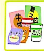
レトルト食品 ラーメン・乾麺 (そうめんなど)