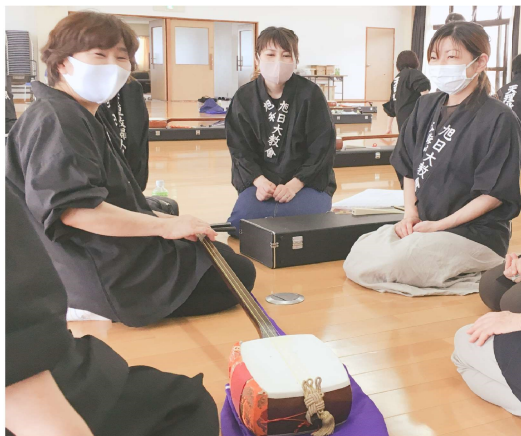
グループに分かれ、糸の巻き方や付け方を学ぶ皆さん熱心に勉強されました。