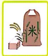
米・玄米・レトルトご飯など