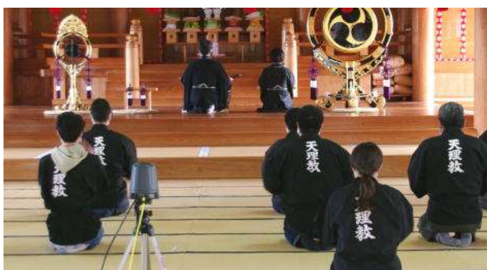
大教会神殿でお願いづとめ

当日は、10時より大教会神殿で、大教会長様を芯に「お願いづとめ」がつとめられ、その後、大教会長様のご挨拶、大教会奥様のご挨拶、青年会委員長の挨拶がありました。この模様は、YouTubeにてライブ配信されパソコンやスマホ等でのリモート視聴が51ヶ所ありました。また、大教会神殿では、大教会在勤者や修養科生、スタッフ等28人が参加されました。