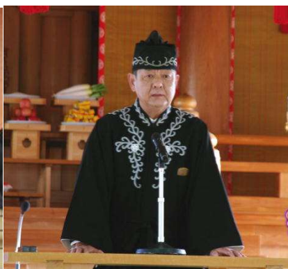
大教会長様ご挨拶