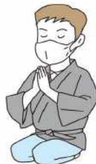
マスクを着用してもよい